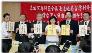
董氏基金會 JOHN TUNG FOUNDATION