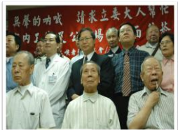
董氏基金會 JOHN TUNG FOUNDATION