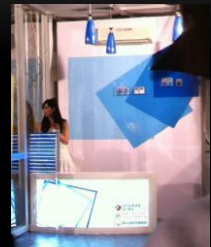
啤酒節擺設販菸攤位