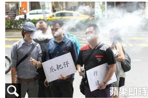
菸權會到董氏基金會抗議。（警語：吸菸有害健康）