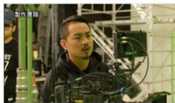
拒菸舞士TVC-4/29拍片花絮